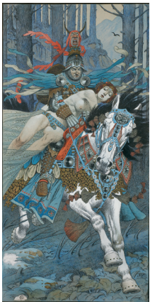
Enlèvement d'une femme par un cavalier , vers 1891 Plume et encre noire, aquarelle gouachée sur papier, 57 x 28 cm