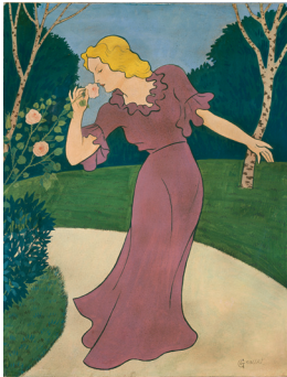
Femme à la rose , s. d. Plume et encre, aquarelle sur papier, 65 x 50 cm