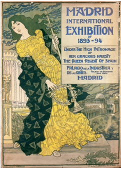
Madrid International Exhibition of 1893-94 Palacio de la Industria y de las Artes, 1893 Chromolithographie, 150 x 109 cm