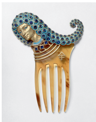
Peigne Assyrienne , 1900 Corne, or, émail, améthystes et brillants, 15 x 10 cm Maison Vever bijoutier d'après un dessin de Grasset