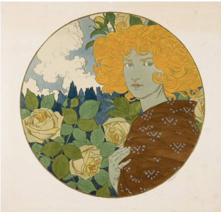
Jalousie (Dix Estampes décoratives, no 9) , 1897 Chromolithographie, 85,6 x 86,2 cm