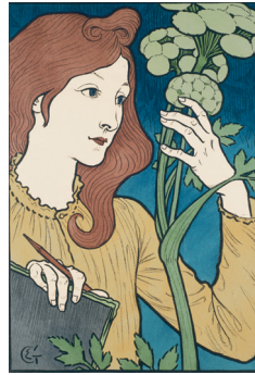
Salon des Cent (sans la lettre, épreuve de l'édition de luxe) , 1894 Gillotage coloré au pochoir sur simili Japon, 53,2 x 37 cm