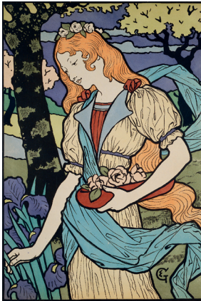
Exhibition of decorative artists in the Grafton Gallery London , 1893 Chromolithographie, 69 x 47 cm