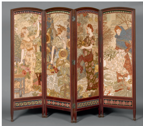
Paravent Les Quatre Saisons , s. d. Bois et broderies polychromes, 167 x 55 (x 4) cm © Petit Palais, musée des Beaux-Arts de la Ville de Paris Photo : Eric Emo / Petit Palais / Roger-Viollet