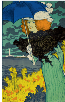
Le Parasol , 1900 Chromolithographie, 130,1 x 88,7 cm