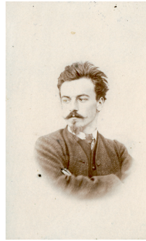
J. Tarin Eugène Grasset vers 1875