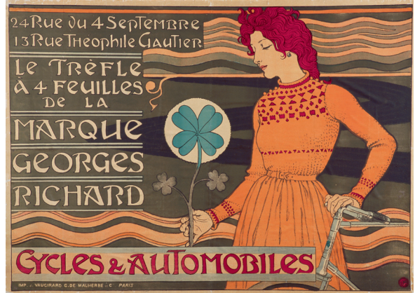
Le Trèfle à quatre feuilles de la marque Georges Richard. Cycles & Automobiles , 1897 Chromolithographie, 106 x 147 cm