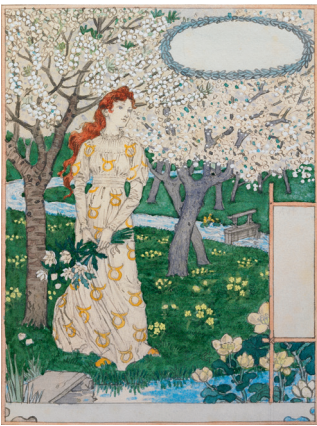
Avril Crayon et aquarelle sur papier vélin, 28 x 21 cm Projet pour le Calendrier pour 1896 offert par La Belle Jardinière