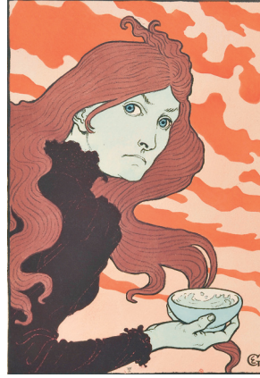
La Tasse de grès (La Vitrioleuse) , 1893 Chromolithographie, 39,5 x 27,5 cm Édité par L'Estampe originale