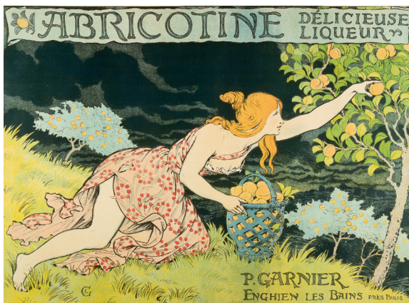
Abricotine. Délicieuse liqueur , vers 1900 Chromolithographie, 75 x 109,5 cm