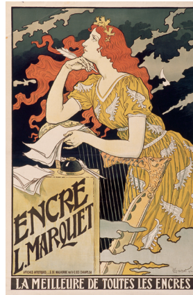
Encre L. Marquet – La meilleure de toutes les encres , 1892 Chromolithographie, 121 x 82 cm.