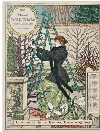
Février Page du Calendrier pour 1896 offert par La Belle Jardinière Chromotypographie, 23 x 18 cm.