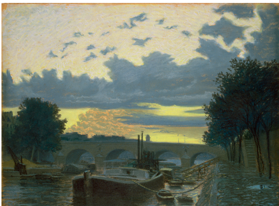
Après la pluie (Le Pont-Marie) , 1904 Pastel sur papier de couleur, 50 x 64,8 cm